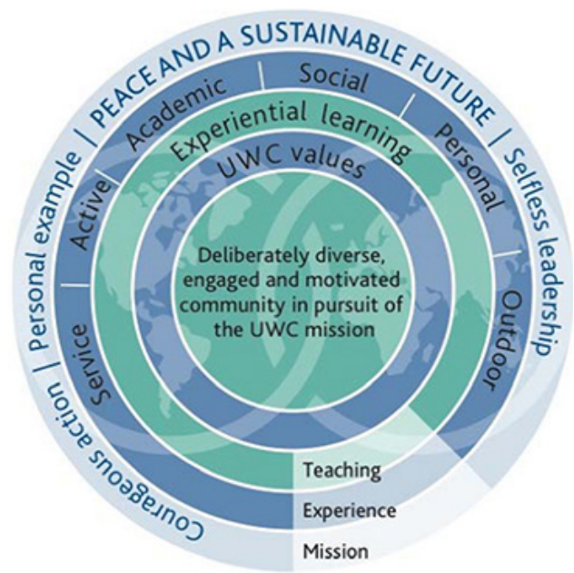
UWC Educational Model